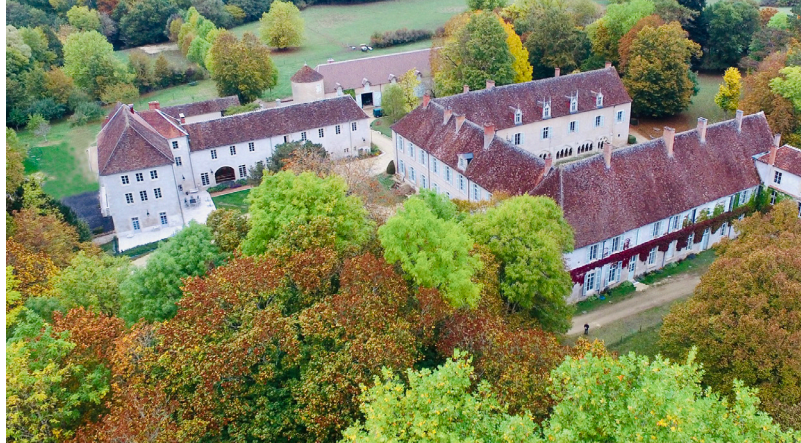
La Prée vue du ciel